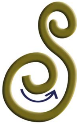
8, Luman Spiralige Drehung harmonisch und schön.