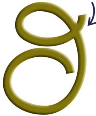
13, Öchim Den Anker gelöst zyklisch fließend und frei.