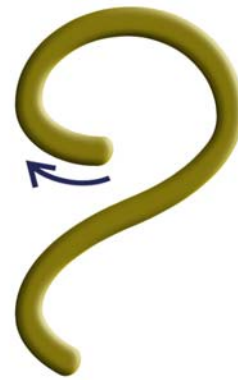
7, Hol Im Rhythmus der Erde die klärende Kraft.